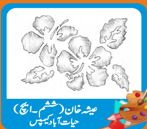
عیشہ خان (ہیثم۔انج) حیات آباد کیمپس