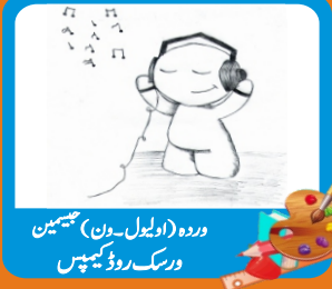
وردہ (اولیل۔ون۔حسین) ورسک روڈ کیمپس