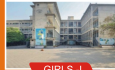
GIRLS - I