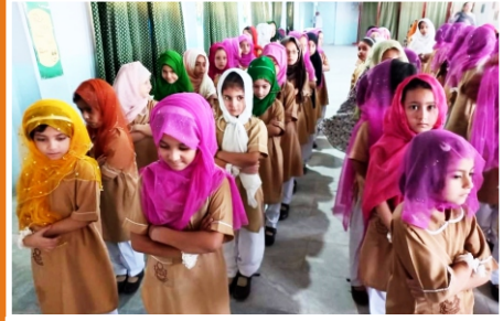
1st Morning Assembly Presentation by Students of Play, Nur and Prep Hayatabad campus