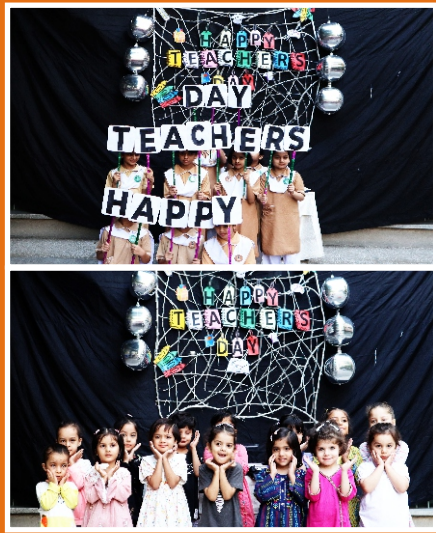
Teachers Day Celebration Warsak Road, Peshawar

Peshawar Model Girls High School 5 Dalazak Road was a grand event, with participation from all the campuses, including Peshawar Model Girls High School Warsak Road. It was a day filled with excitement and camaraderie as students showcased their athletic talents. Peshawar Model Girls High School, Warsak Road got the top position in volleyball, and secured the second Position in the "short race" and in the "toss the ball". Every campus showed their enthusiasm and won trophies. Winning is not only victory but losing a game is also courage.