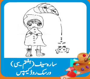
سارہ سیف (ہیثم۔سی) ورسک روڈ کیمپس