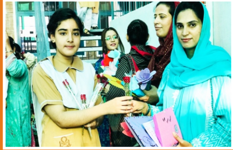
Teachers Day Celebration Hayatabad Campus