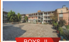
BOYS - II