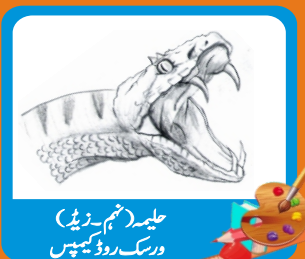
علیہ (ہیثم۔زیڈ) ورسک روڈ کیمپس