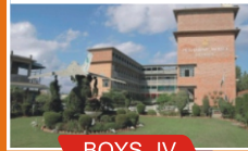
BOYS - IV