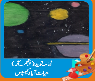
آنا مریڈ (ہیثم۔آر) حیات آباد کیمپس