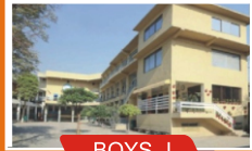
BOYS - I

PESHAWAR MODEL GIRLS HIGH SCHOOL WARSAK ROAD / HAYATABAD CAMPUS