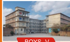
BOYS - V