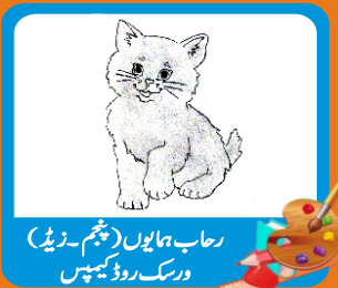
رحاب ہمایوں (ہیثم۔زیڈ) ورسک روڈ کیمپس