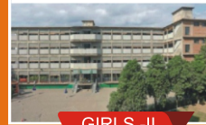
GIRLS - II