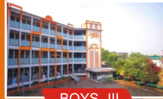
BOYS - III