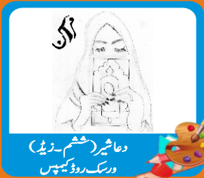
وحاشیرہ (ہیثم۔زیڈ) ورسک روڈ کیمپس