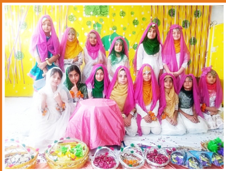
Mehfil-e-Milad Hayatabad Campus