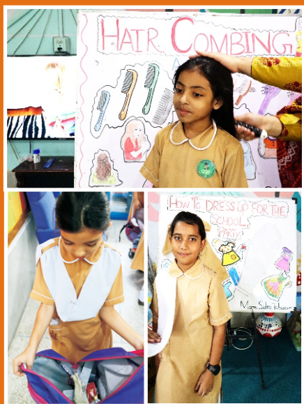
Self Care Activities Warsak Road, Peshawar