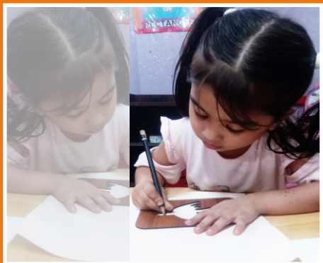
Stencil Activity Hayatabad Campus