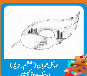
حائل عمران (ہیثم۔زیڈ) ورسک روڈ کیمپس