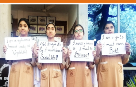
Mental Health Day Observation by O-Level Students Warsak Road, Campus