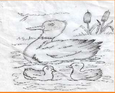
آمنہ خان ششم - زید ورسک روڈ کیمپس