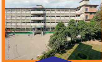
GIRLS - II