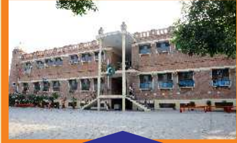
BOYS - VII