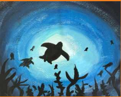
انزلیہ کانی وہم - پی ورسک روڈ کیمپس