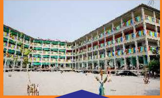
BOYS - VI