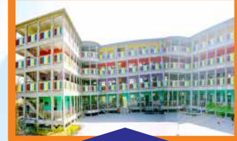
GIRLS - III