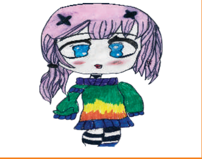
مہوش خان ہفتم - زید ورسک روڈ کیمپس