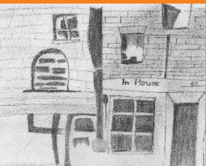
عائکہ ماجد اویول - (ذبی) ورسک روڈ کیمپس