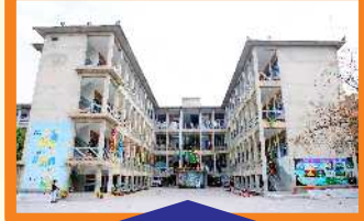
GIRLS - I